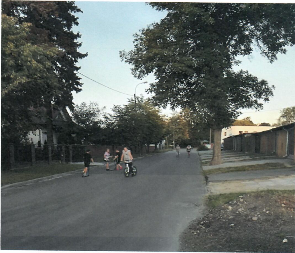
Zał. nr 1